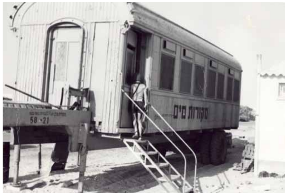
הכיתה הראשונה בקרון רכבת שימש בית ספר בעין יחב

היה זה, כמובן מעבר ליכולתי, ועל אף שקיימתי שיחה עם כמה פעילים בנגב הרחוק, לא יצא מכך דבר. מדוע הוא ביקש זאת מאתנו ולא ממומחים? כנראה משום שאנחנו העזנו לנסות ועשינו את הבלתי אפשרי.