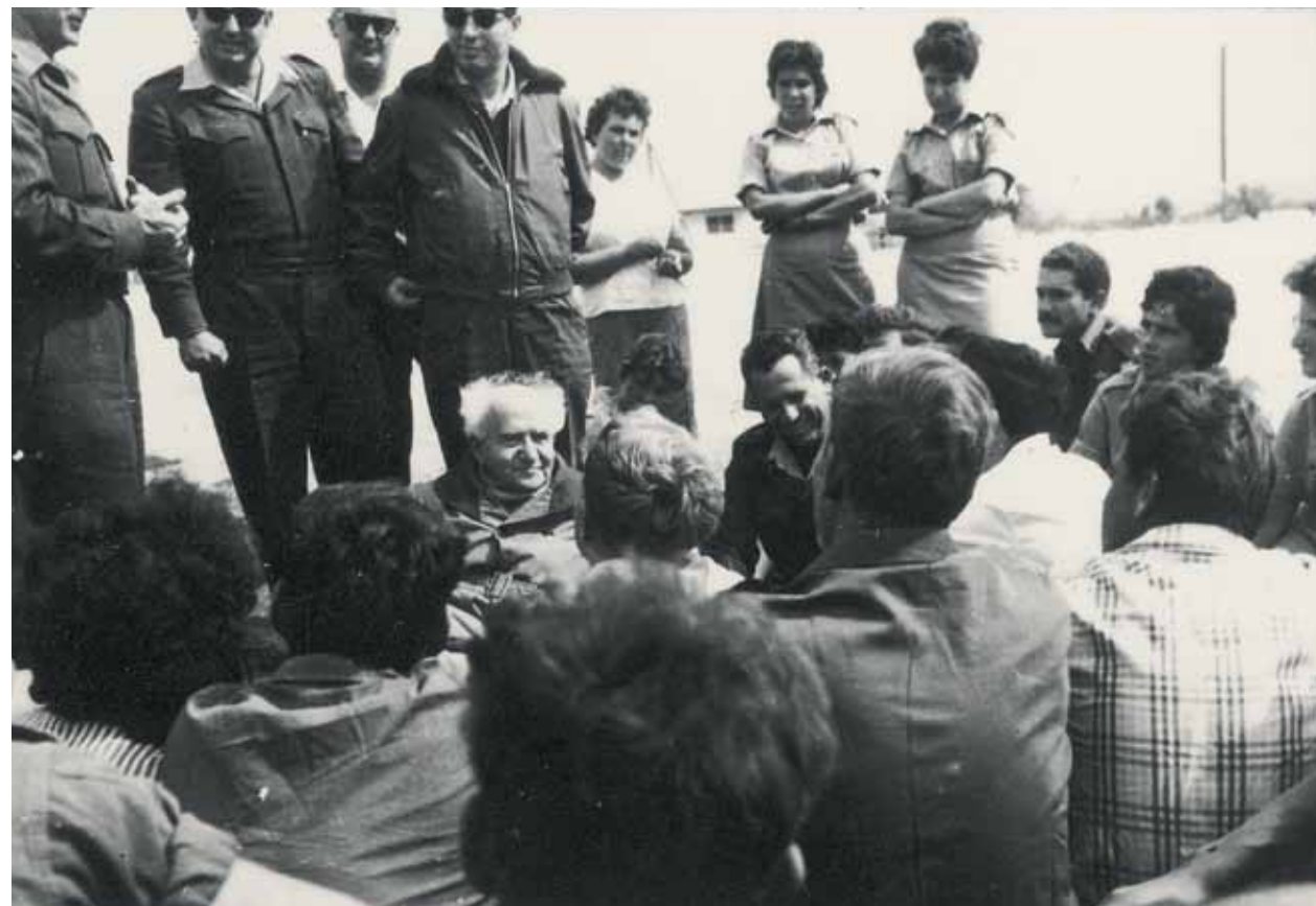
למעלה: דוד בן־גוריון וואשתו פולה בעת ביקור בעין יהב למטה: דוד בן־גוריון ושמעון פרס (עומד מאחוריו) בעת ביקור בעין יהב