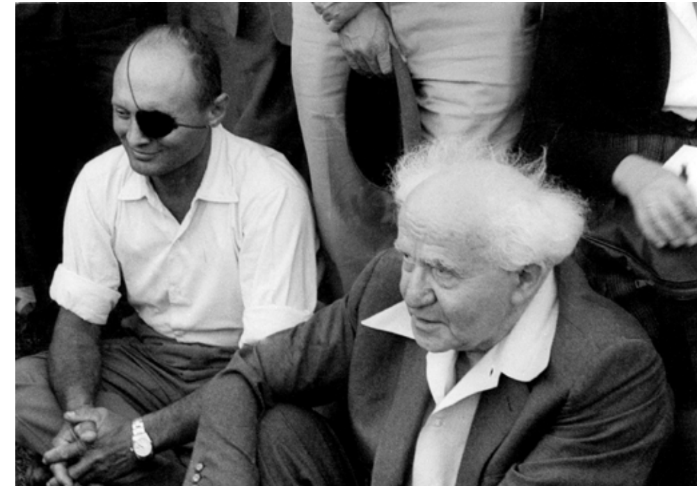
דוד בן־גוריון ומשה דיין (שר החקלאות) בטקס האיזרוח של האחוזות עין יהב, 1962

אמר. השעה הייתה קרוב ל-12. שאלתי חרש: "מתי ניתן לקבל את המכתב?" ונעניתי בפסקנות: "מה פירוש מתי? היום". נכנס הנהג ושאל: "נוסעים הביתה?" ובן־גוריון ענה: "לא, למשרד". אני נדחק בשאלה: "אפשר לנסוע אתך?" ובן־גוריון עונה: "וראי". לקחוני שומרי הראש, ארזוני ביניהם במושב האחורי, ו"היידה" נוסעים.