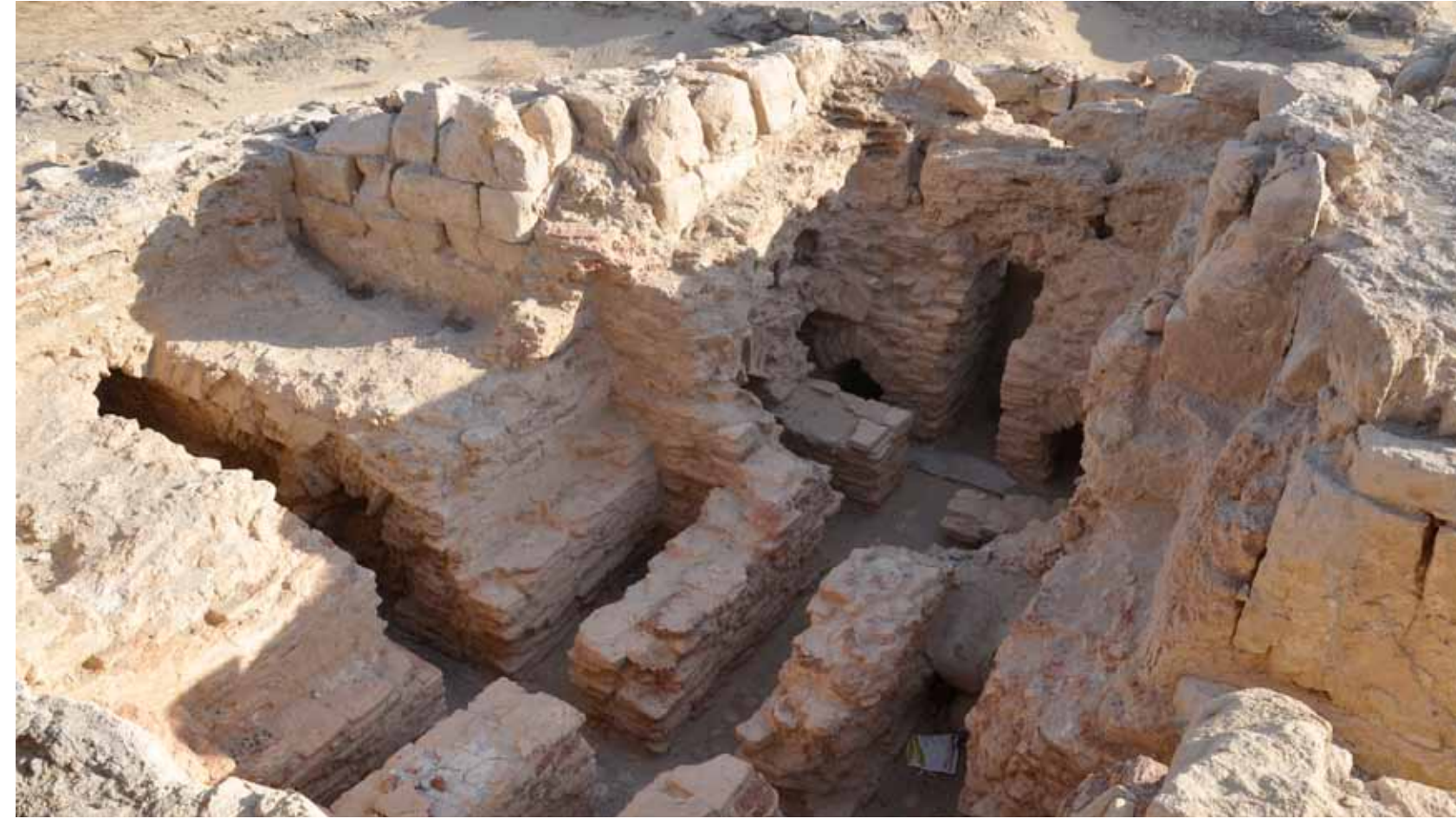
בית המרחץ הרומי

עם קום המדינה החל צה"ל להשתמש במתקני המשטרה הבריטית. הוא הקים כאן בסיס צבאי קטן ששימש את היחידות ששמרו על כביש הערבה, במשך כמעט עשרים שנה. בשנת 1967 עברו חברי