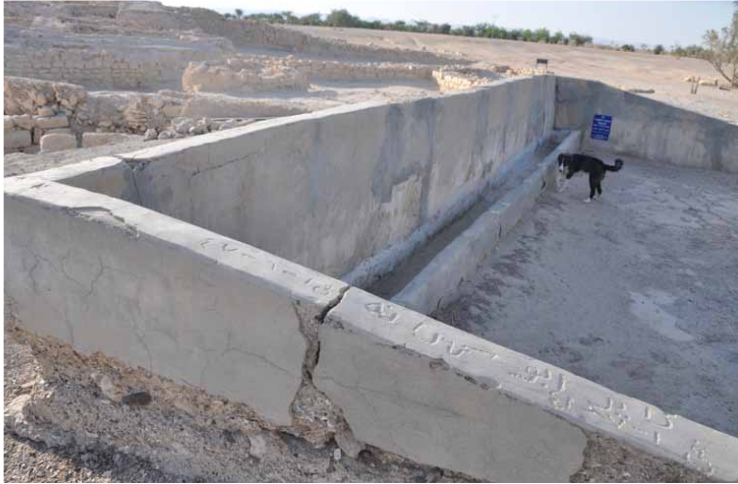
השוקת שנבנתה בתקופת המנדט הבריטי להשקיית הגמלים ולרחצה. על דופן השוקת אפשר להבחין בחריטת שמות השוטרים בערבית

המדבר, הקימו משטרת רוכבים וכמה תחנות במדבר — במלחתה, בכורנוב (היום ממשית) ובעין חוצוב, ביטבתה ובאום רשרש. המבנה הבהיר בראש הגבעה, סמוך למצודה הרומית, הוא אחד מחמשת המבנים ששימשו את משטרת הגמלים הבריטית.