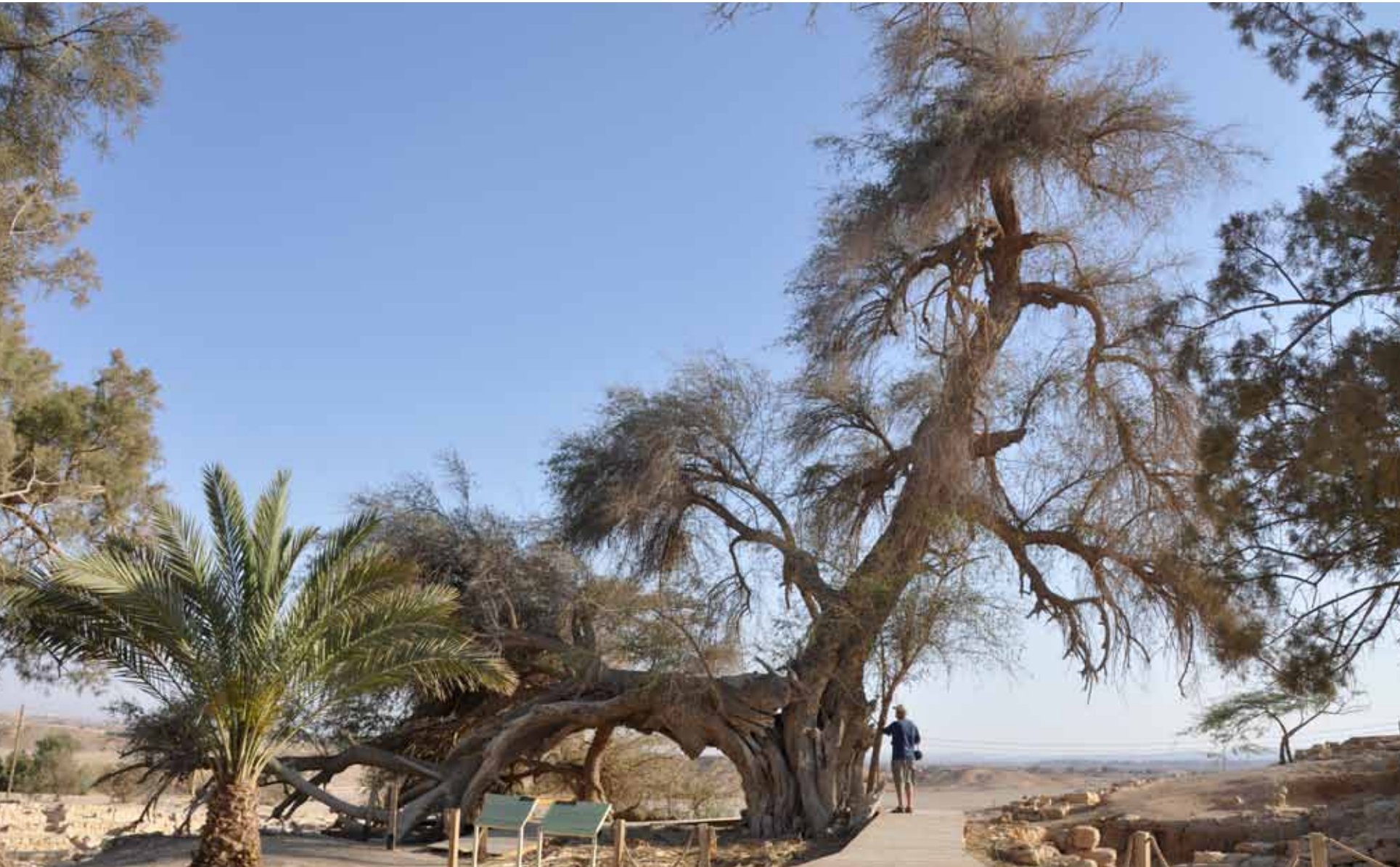
עץ השיזף העתיק

לאחר הליכה של כ-30 מ' ועלייה בגרם מדרגות נגיע לרחבה שמרכיבה לא נחפרה. רחבה ניתן להבחין בשרידי חומותיה ומגדליה של המצודה מהתקופה הרומית המאוחרת. המצודה כללה מערכת חדרים מסביב לחצר רחבה. אפשר להבחין בה בכיורון בשני שלבי בנייה. במחצית השנייה של המאה השלישית נבנתה מצודה ריבועית שאורך צלעותיה 46 מ'. בשלהי אותה מאה, כנראה בימי