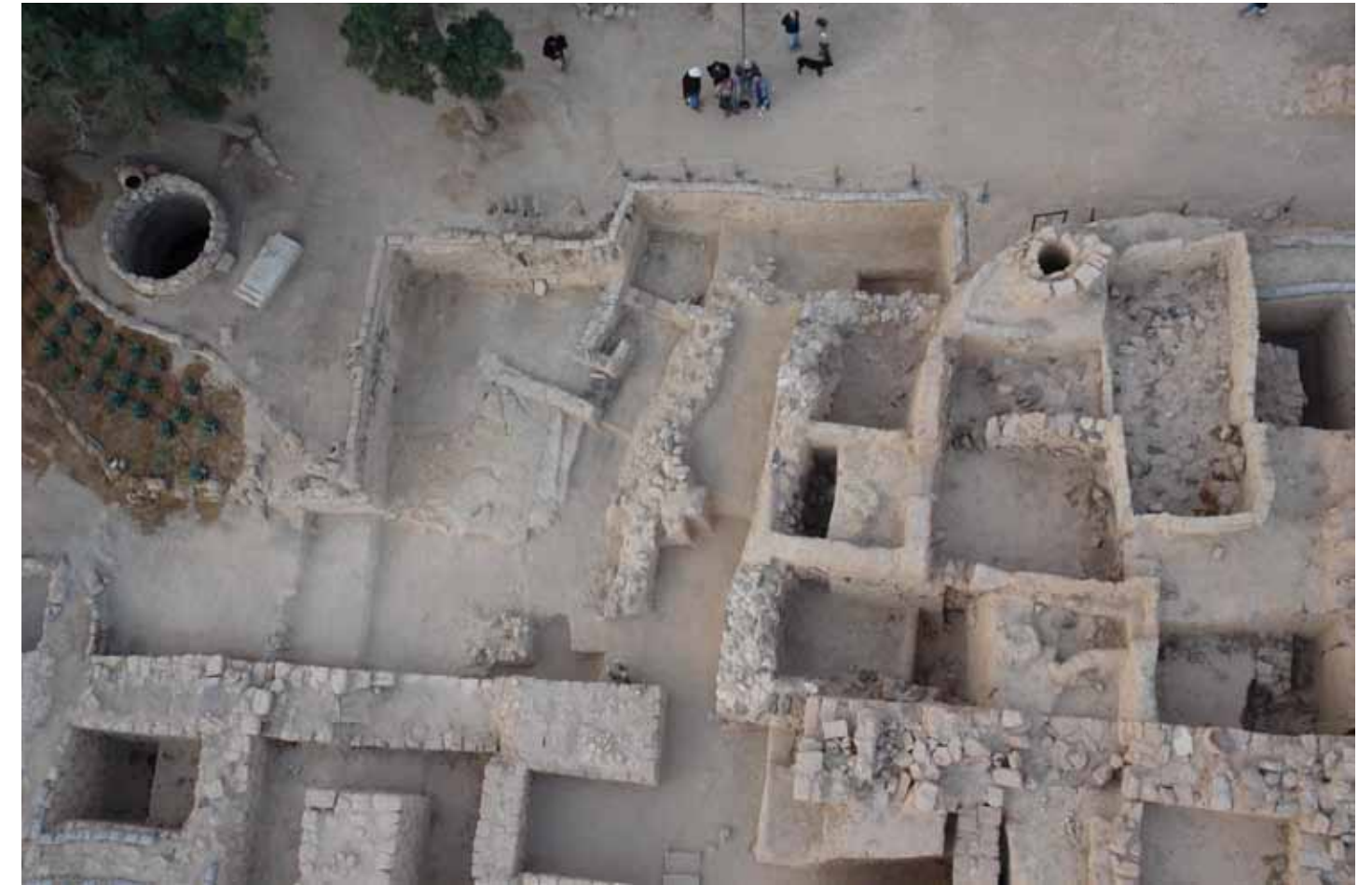
המעין וקטע מהחפירה הישראלית