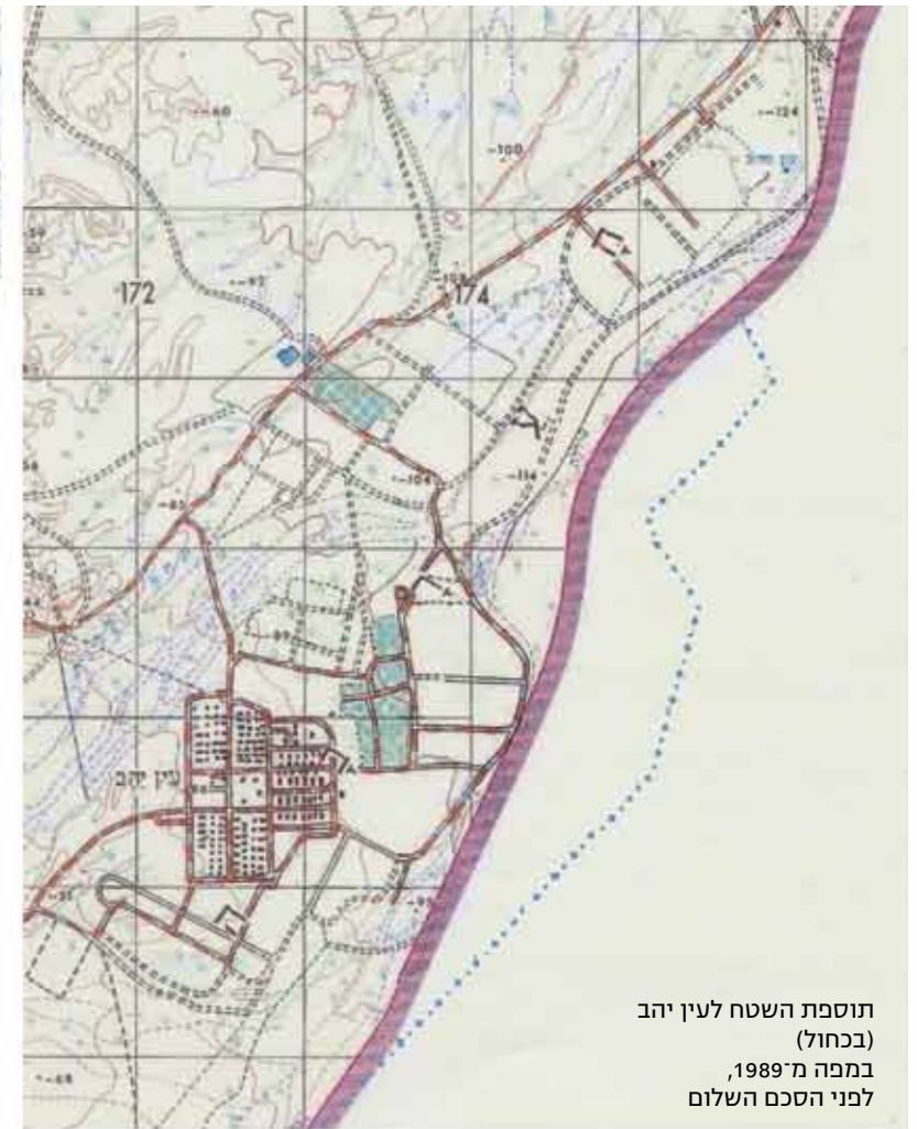
קו הגבול באזור עין יהב לפני הסכם השלום ואחריו