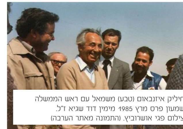
חיליק איזנבאום (טבע) משמאל עם ראש הממשלה שמעון פרס מרץ 1985 מימין דוד שגיא ז"ל.

בשנת 1978 נבחר לראש המועצה השני בערבה התיכונה. בתקופת כהונתו הוקם ואוכלס היישוב האזורי ספיר. משפחתי לייצור מוצרי קוסמטיקה