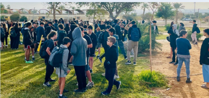
מתכנסים להבעת תמיכה בחטופים ובחטופות