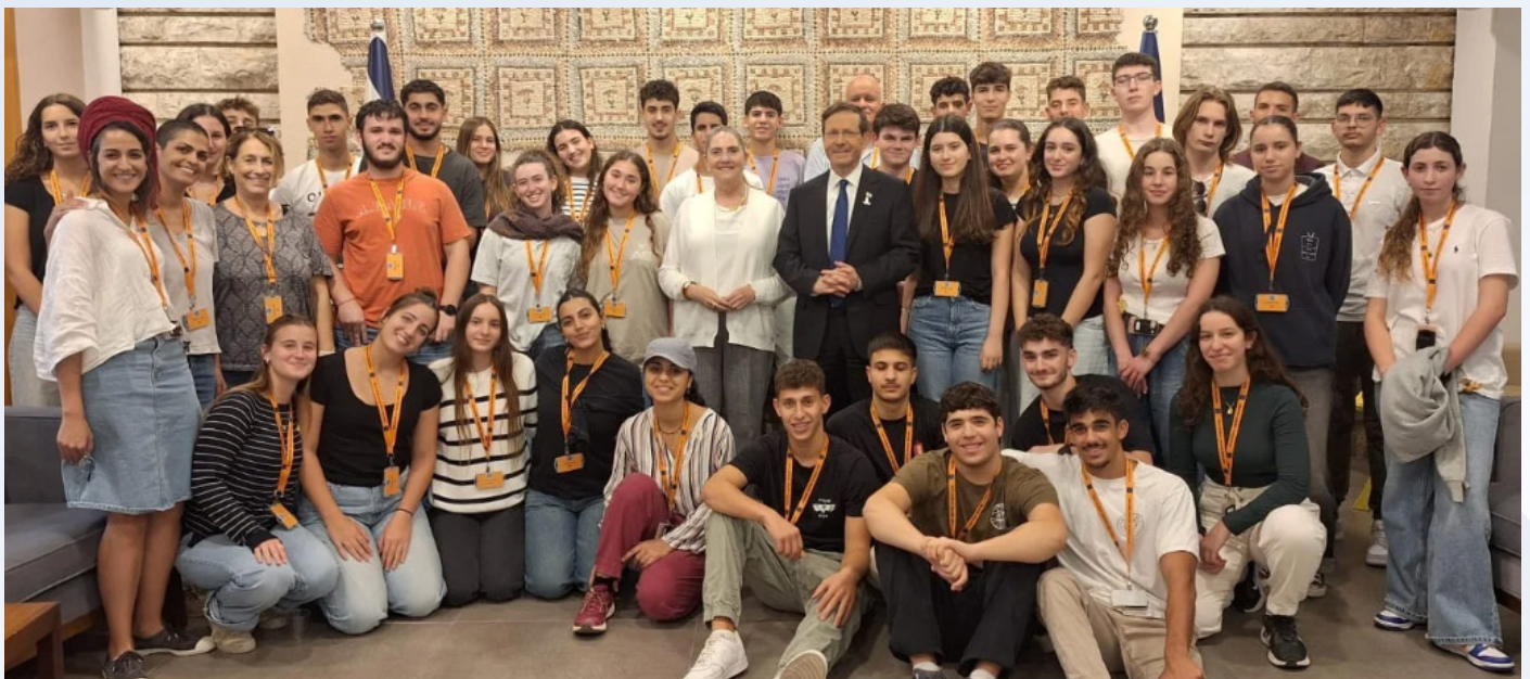
בבית הנשיא עם יצחק ומיכל הרצוג

ביקור בבית הנשיא ומפגש אישי עם כבוד הנשיא הרצוג ורעייתו מיכל ביחד עם מאיר צור ראש המועצה.