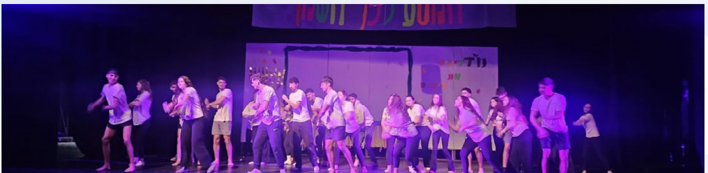
תלמידי יב מחזור מ"ד מופע חנוכה מרגש שלא השאיר עין אחת יבשה